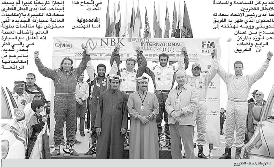
الأبطال لحظة التتويج

كما وجه رئيس الاتحاد شكره إلى السويدي يان ساند ستروم المسؤول عن القضاة على إشادته